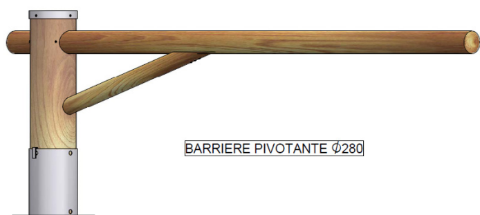
BARRIÈRE PIVOTANTE \varnothing 280