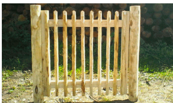
Face avant du Portillon