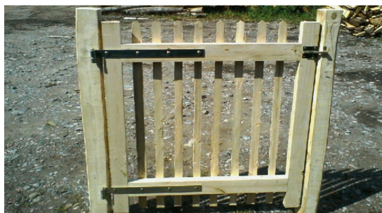
Face arrière du Portillon