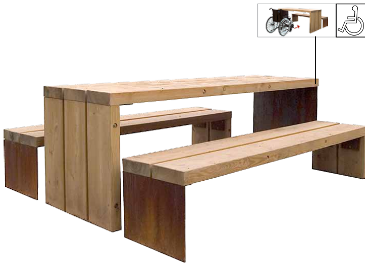
TABLE PIQUE NIQUE GAVARRES