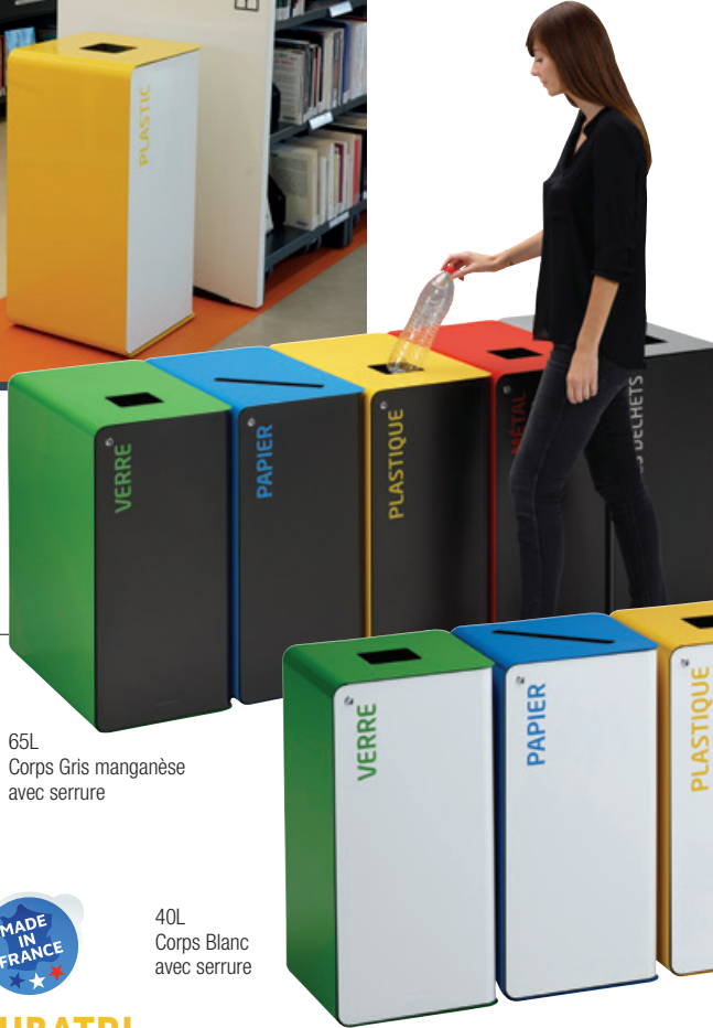
65L Corps Gris manganèse avec serrure