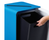
40L : Vidage de la poubelle grâce au bac intérieur en polypropylène recyclé