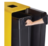
65L : Vidage de la poubelle grâce au bac intérieur plastique roulant intégré