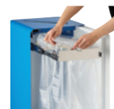
75L et 90L : Vidage de la poubelle grâce au support sac coulissant intégré