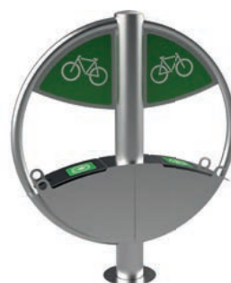
Version avec Stickers Vélos